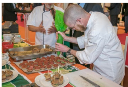
Un chef sur l'Allée du Goût

Et pour la première fois aussi, des « Flash Conf », mini-conférences de 15 à 30 minutes sur des problématiques clés du secteur, ont aussi suscité beaucoup d'intérêt.